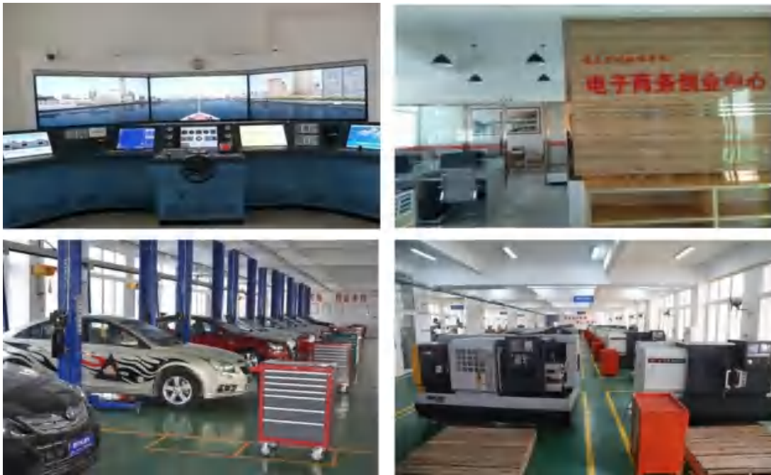
图 8 校内实训基地