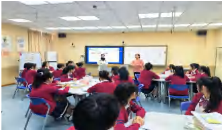
图 2 通用职业素养课程改革