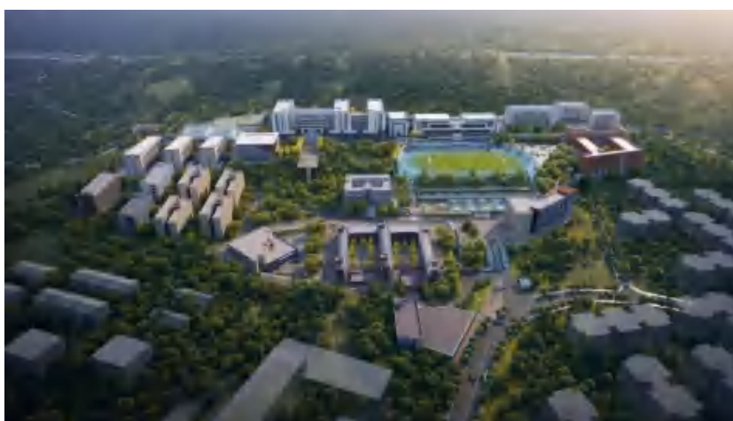
图 1 学校整体规划图

重庆万州技师学院建校于 1956 年，2013 年由重庆市经济贸易学校和重庆市万州技工学校、重庆市万州商业学校整合创建而成，隶属重庆市万州区人力资源和社会保障局主管。学校秉承万心融慧，技献九州的办学理念，以鼎技经世，汇心济民为校训，精勤严实，智信博专的校风、新学新教，共生共长的教风、知行合一，学以致用学风，立志办成具有国际视野、全国领先、重庆一流的高水平技工院校。学校是渝东北片区唯一的一所公办技师学院，是中央电视台《中国大能手》栏目合作院校、第八届全国高职高校木作技艺竞赛承办院校，是一带一路国际技能大赛承办院校。经过六十余年的办学积淀，学院现已成为全国唯一连续七年被评为内河五星级船员培训院校，是全市唯一木工项目世界技能大赛国家级集训基地，渝东北唯一国家级高技能人才培训基地和国家级综合职业培训基地，在全市 46 所技工院校综合评估中名列第 3 位，是国家级重点中职学校、市级示范校单位。