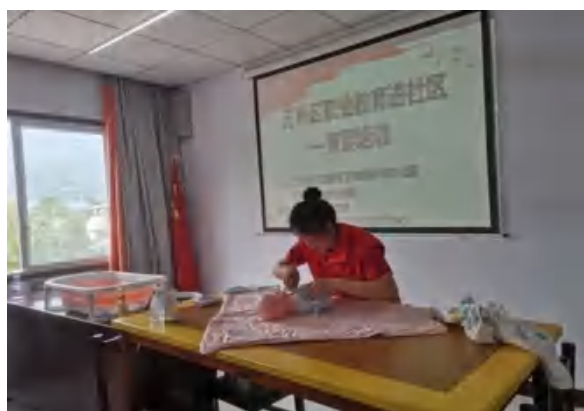
图 6 幼教专业为社区开展育婴知识培训活动