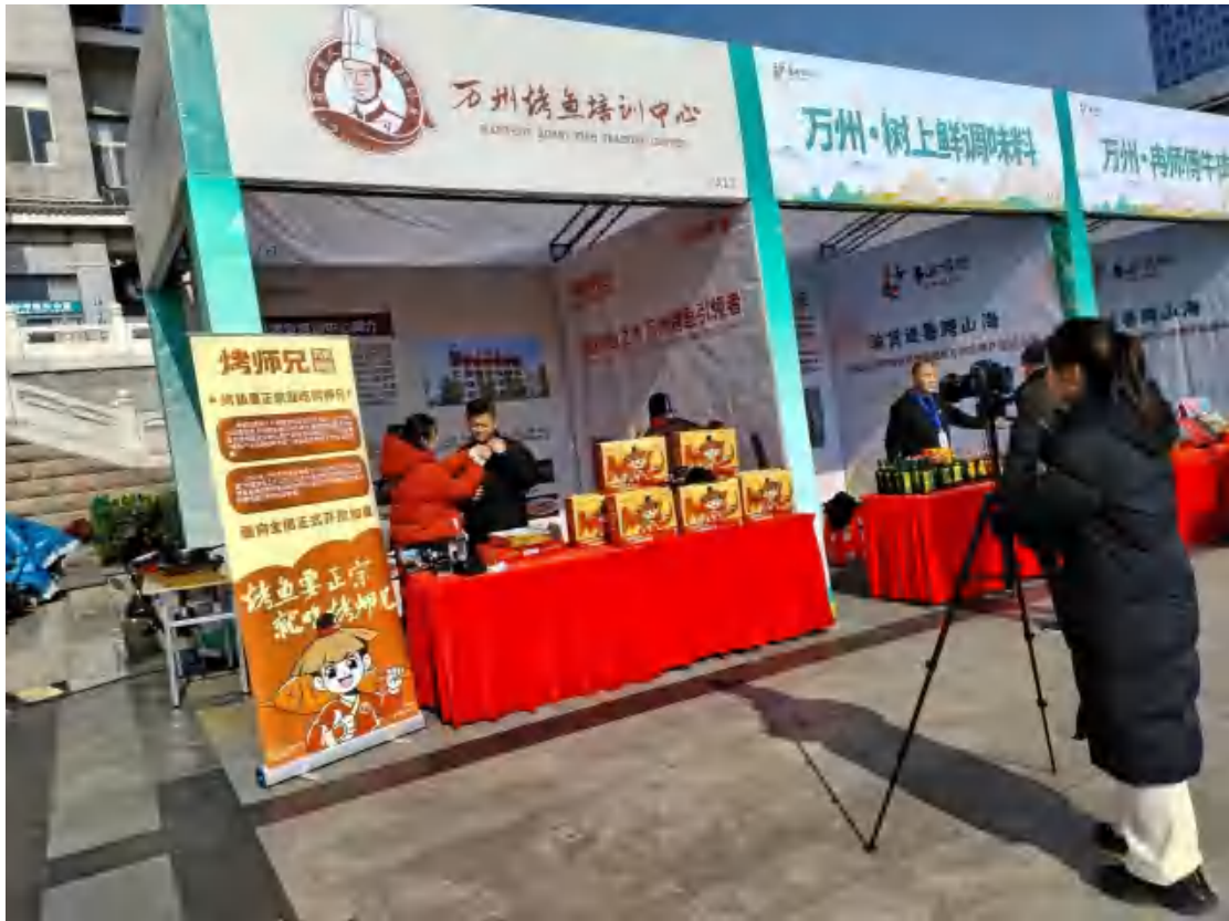
培训中心赴济宁参加万州农特产品进山东暨万州文旅推介会