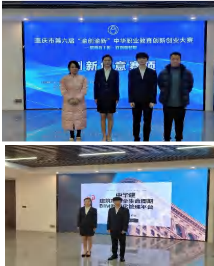
图 3 创新创业大赛