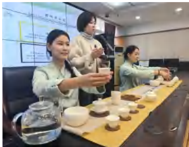
图 5 旅游专业为社区开展茶艺技能培训活动

生活方式，掌握一门生活技能，也让更多人了解并热爱这项传统技艺，更好传承中华优秀传统文化。我校幼教专业教师和学生志愿者一行走进沙河街道安乐社区学习中心，为居民们开展了育婴知识培训活动。