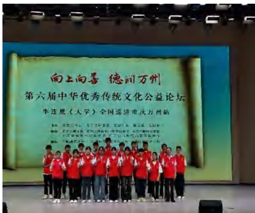
图 4 第六届中华优秀传统文化公益论坛志愿者服务活动

2022-2023 度，我校按例开展“学生对学校满意度的问卷调查”，总体上学生在校体验为非常满意，其中：理论学习满意度为 83%，基本与上年保持相当水平；专业学习满意度为 93%；实习实训满意度为 98%。本学年，学校进一步加强校园文化建设，丰富业余生活，校园文化满意度为 91%；社团活动满意度 90%；校园生活满意度为 98.3%；校园安全满意